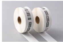
※LP-700SA2のみ使用可 (LP-500Sシリーズでは使用できません)

ラベル用紙の材質変更(キャスト、ユボなど)、及び特注サイズでの加工を承ります。 ● 用紙種類 / 上質感熱紙、キャスト(コート紙)、ユボサマー、高耐久感熱紙 ● サイズ / LP-500Sシリーズ: 幅32mm、40mm、52mm / ピッチ12mm~80mm LP-700SA2: 幅25~70mm / ピッチ15mm~180mm ● プレ印刷 / 事前のラベルへのロゴマーク・ロゴ書体の印刷など ※専用ラベル紙となります。詳しくは販売店・最寄りの弊社営業所までお問い合わせください。